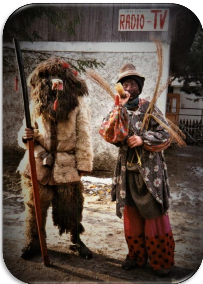
Mascați din Joldești, com. Vorona – CS II dr. Narcisa Știucă, 1997

Ursul este asociat cu omul datorită posibilității sale de a se deplasa biped. De asemenea, are o „casă” (bârlogul), însă nu poate stăpâni focul.