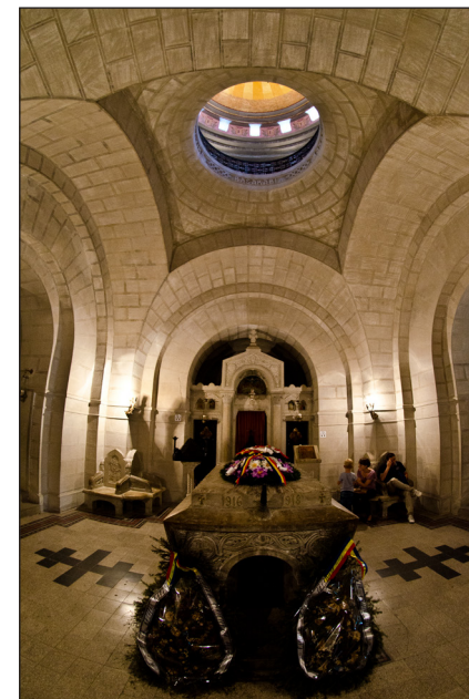
Fig. 7 - Sarcofagul generalului Eremia Grigorescu din camera principală a Mausoleului de la Mărășești