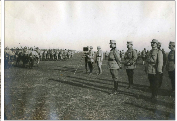
Fig. 4 - Generalul Eremia Grigorescu alături de Regele Ferdinand asistând la defilarea voluntarilor ardeleni, în vara anului 1917

militară, după ce în prealabil studiasse la Facultatea de Medicină și la Facultatea de Științe din Iași. În 1884 a absolvit Școala de ofițeri de infanterie și cavalerie din București și s-a înscris pentru următorii doi ani la Școala de Artilerie și Geniu. Rezultatele sale deosebite l-au determinat să urmeze cursuri de matematică la Sorbona între 1887-1889, urmând ca la întoarcerea în țară să publice lucrarea „Calculul probabilităților aplicat la gurile de foc” și să predea cursuri de algebră superioară la Școala de artilerie, geniu și marină.