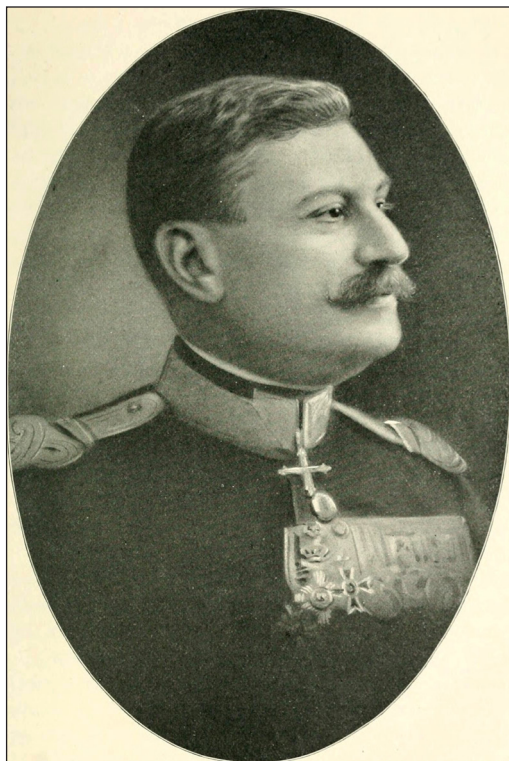
Fig. 1 - Generalul Eremia Teofil Grigorescu