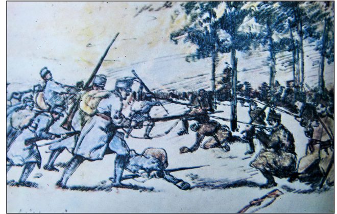
Fig. 5 - Reproducere după desenul „Respingerea unui atac austro-ungar” - de I. Bughardt (din 1916)

„Să cunoaștem în amănunt terenul și inamicul. Terenul te învață cum să ataci, cum să te aperi, cum să te camuflezi. Totul este să-l înțelegi, să-l folosești cu justete, atât atunci când adopți un dispozitiv, cât și când instalezi armamentul de infanterie și artilerie”.