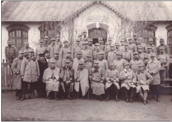
Fig. 2 - General Eremia Grigorescu, în fața Școlii comunale Grozăvești, 1916