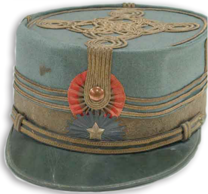
Fig. 6 - Chipiu care a aparținut generalului Eremia Grigorescu