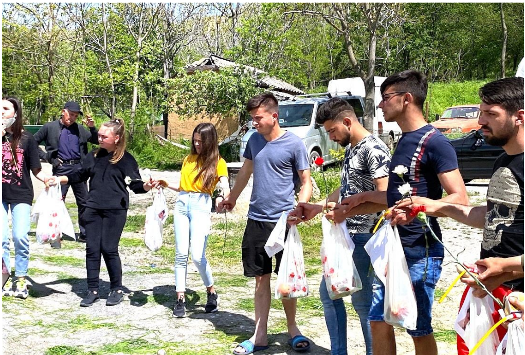
Dansând în hora, cu pachetele primite ca pomană, comuna Una-Clocociov, jud. Teleorman, foto Diana Matei Jilavu, 3 mai 2021