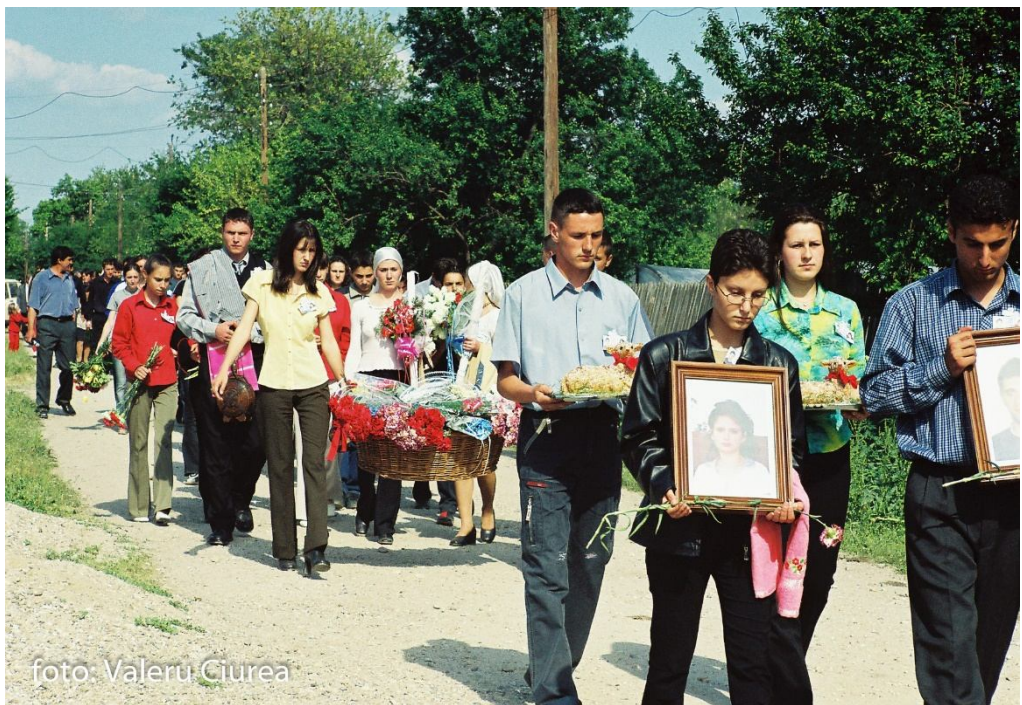
Cortegiul cu tablourile celor pomeniți, comuna Giuvărăști, jud. Olt, 2002