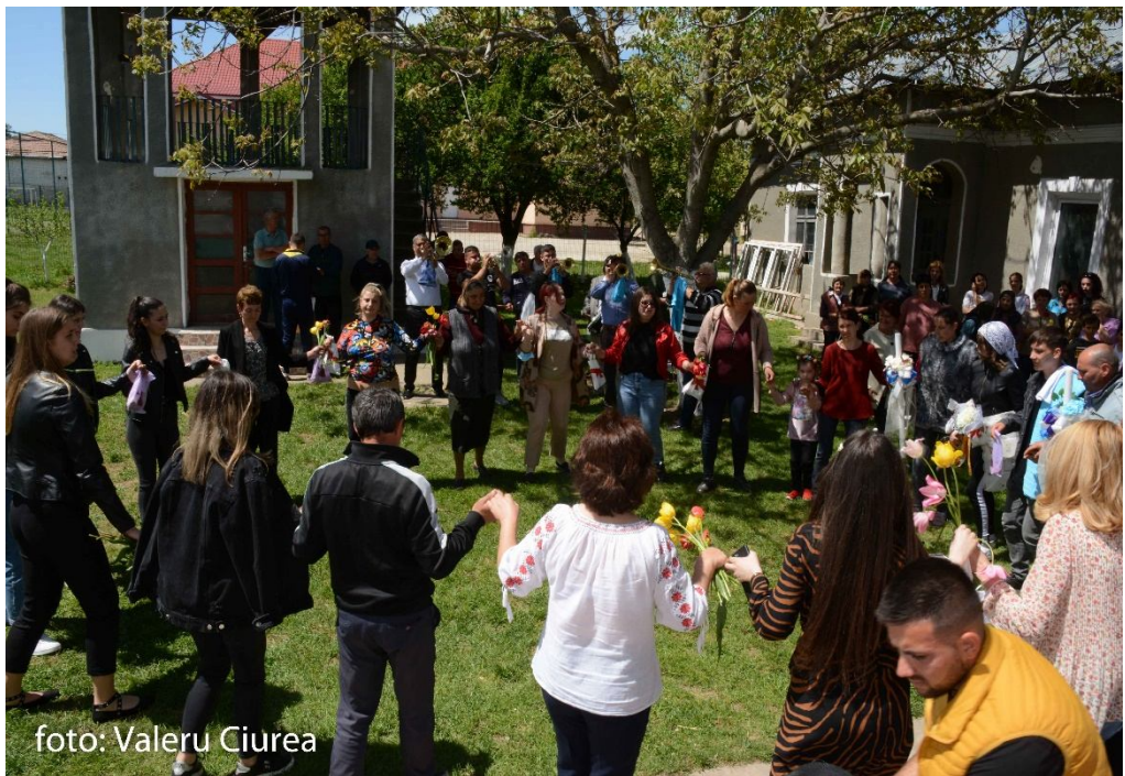
Horă de pomană, comuna Gârcov, sat Ursa, jud. Olt, foto Valeru Ciurea, 3 mai 2021