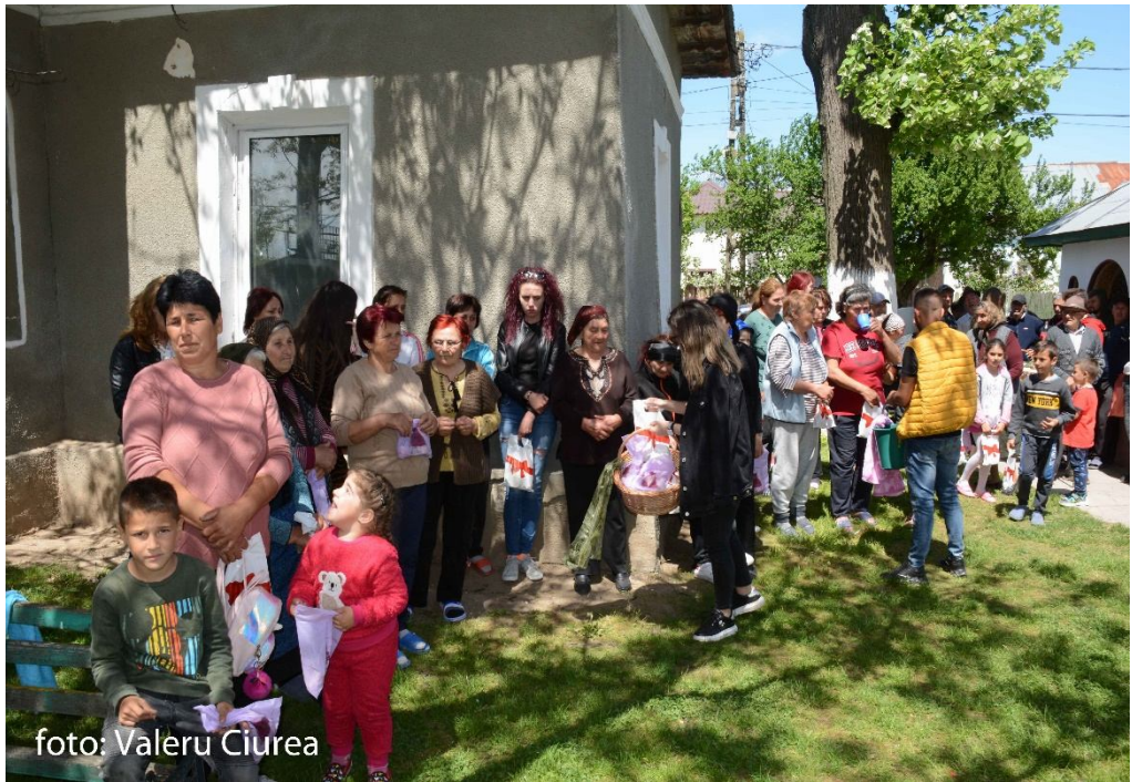
Împărțirea pomenilor, comuna Gârcov, sat Ursa, jud. Olt, foto Valeru Ciurea, 3 mai 2021