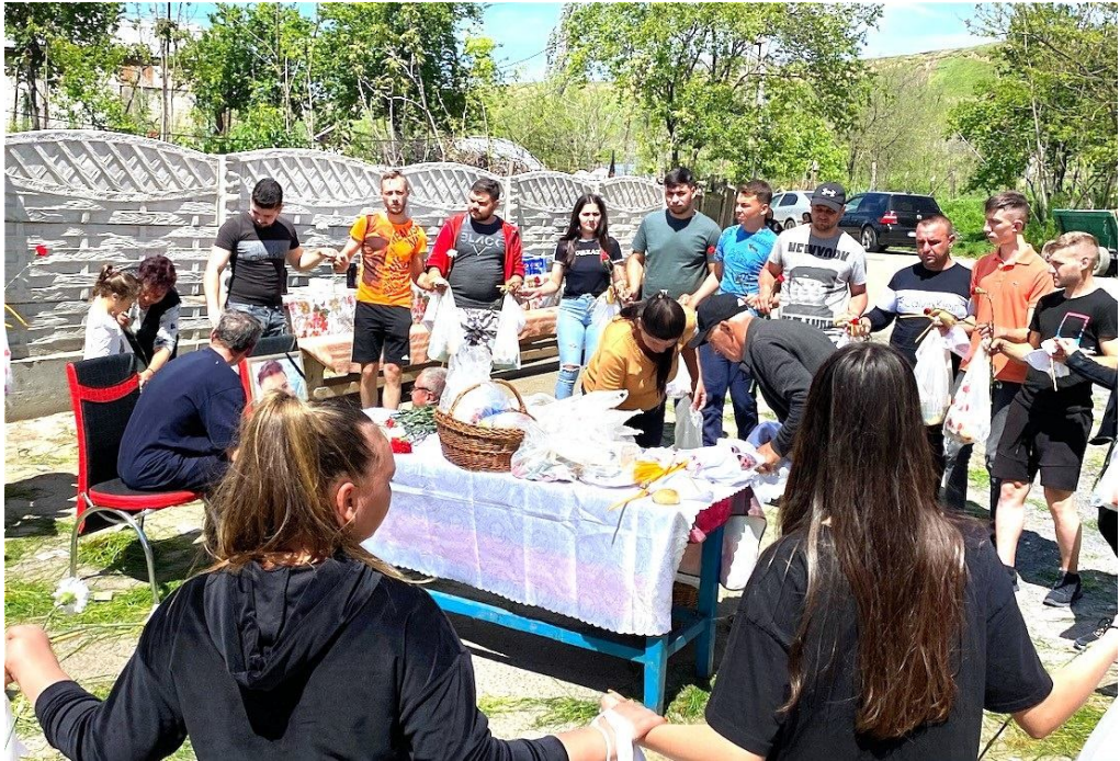
Horă în jurul mesei cu pomeni, comuna Una-Clocociov, jud. Teleorman, 2021, foto Diana Matei Jilavu, 3 mai 2021