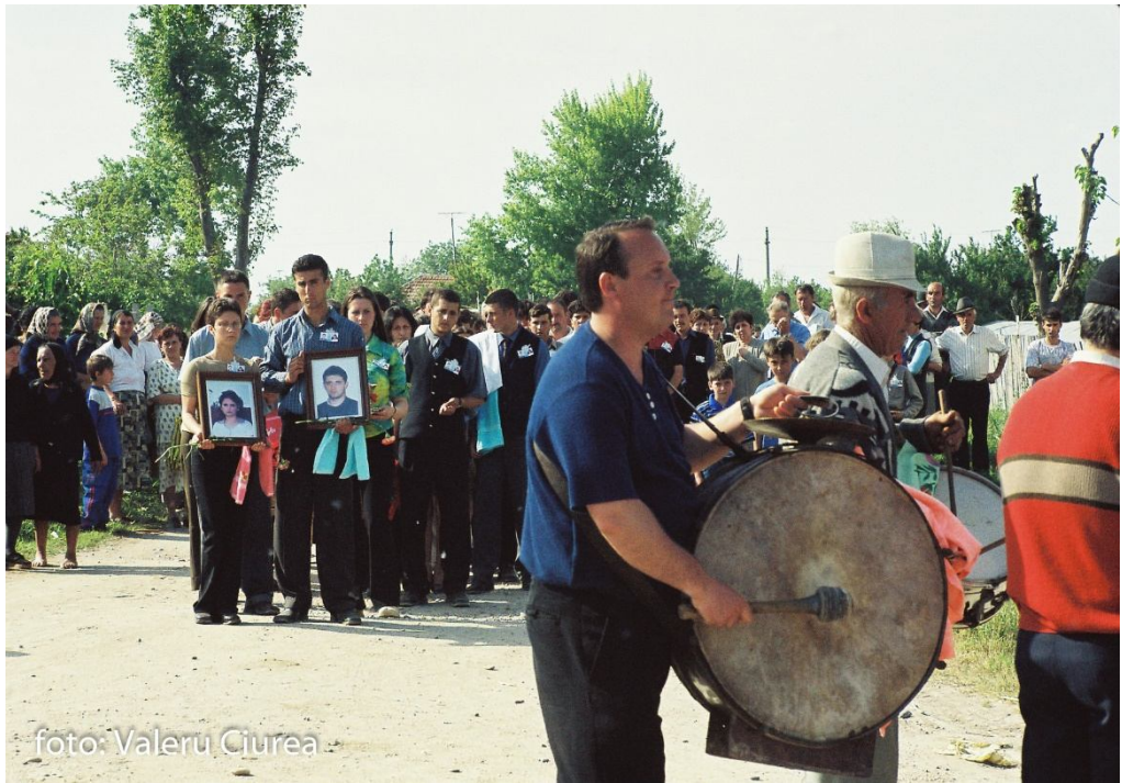
Muzicanții și cortegiul funerar, comuna Giuvărăști, jud. Olt, 2002