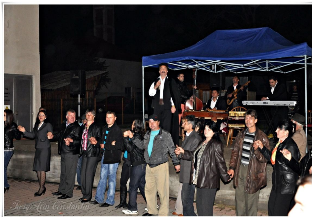
Hora de pomană în comuna Peștișani, jud. Gorj, foto Alina Chiricescu, 2012