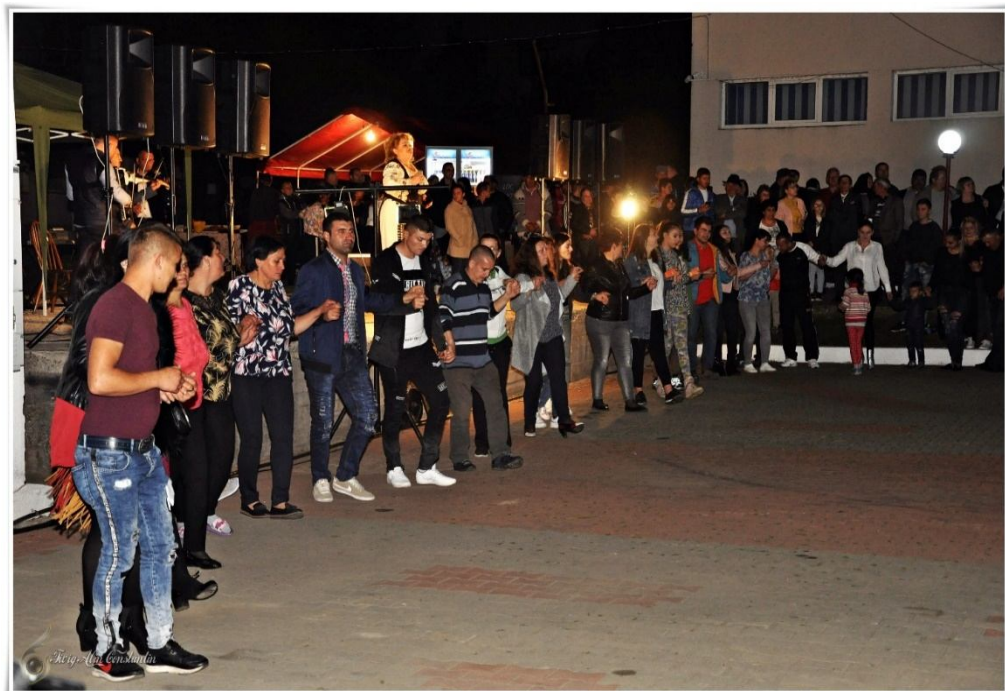
Hora de pomană în comuna Peștișani, jud. Gorj, foto Alina Chiricescu, 2019