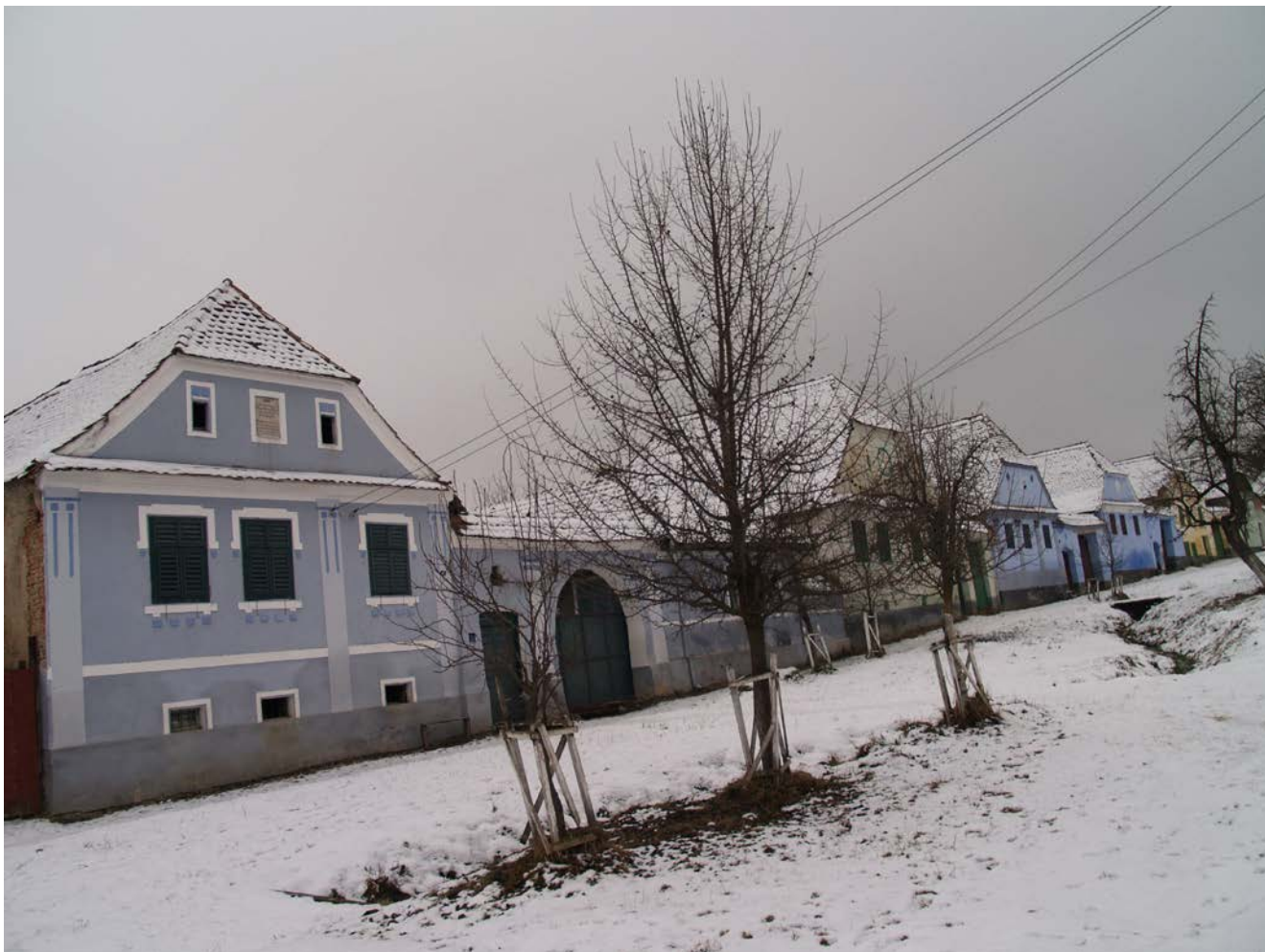
Viscri. Frontul de case sudic al Langgasse, cu fațade reabilite de Mihai Eminescu Trust (MET)

Viscri: 1. Casa nr. 10 – schimbare a dimensiunilor golurilor ferestrelor și montarea unei tâmplării neadecvate. 2. Case construite fără aviz: nr. 111, în fața bisericii ortodoxe, capăt de perspectivă a Străzii Principale și o casă în extravilan, lângă stația de epurare. Primăria a sesizat în 2010 Inspectoratul de Stat în Construcții și Consiliul Județean. 3. Case în ruină: nr. 76, nr. 82, nr. 84 (cumpărată de MET pentru reabilitare), nr. 128 (proprietar o agenție imobiliară).