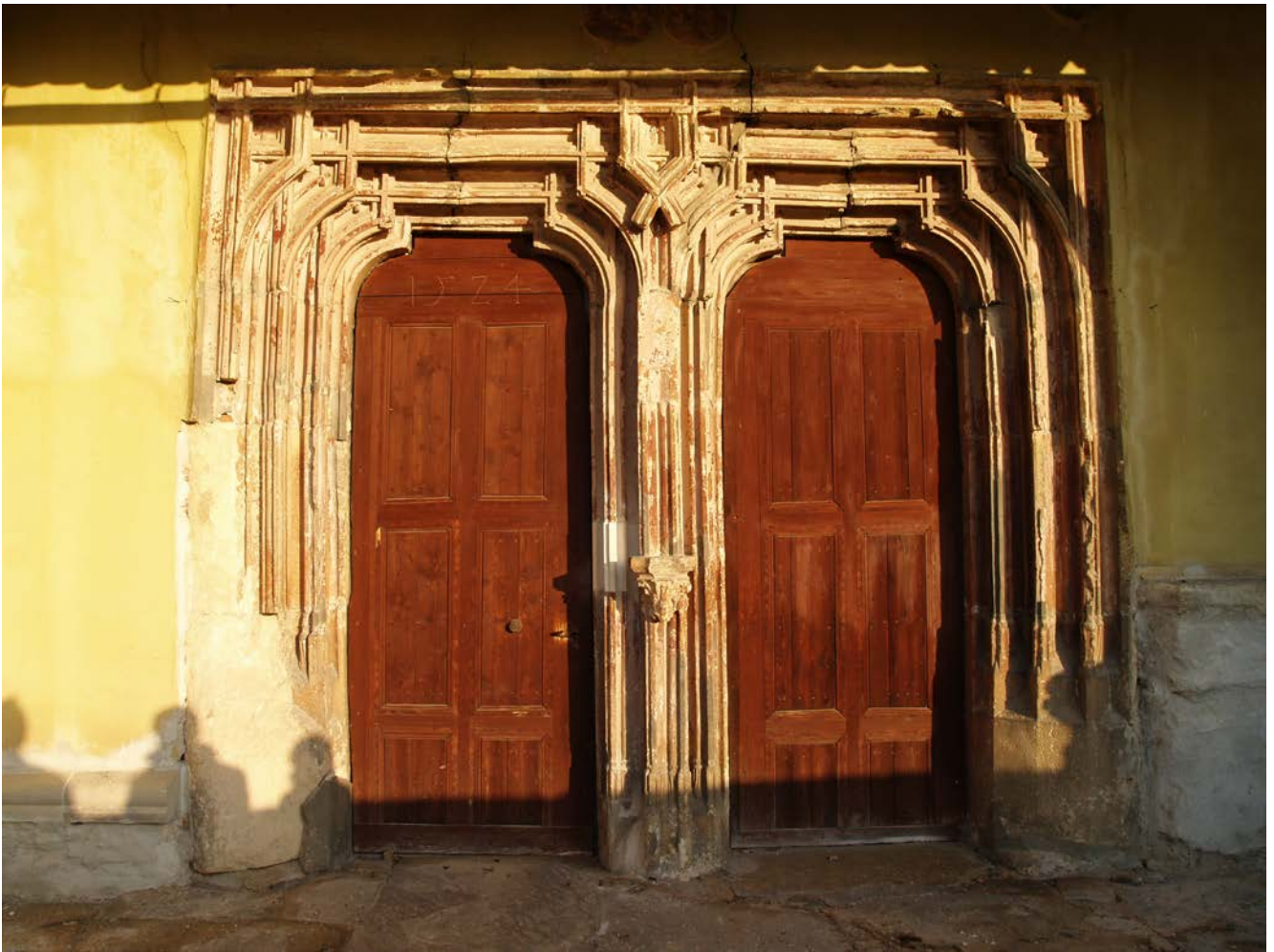
Biertan. Portalul de vest al bisericii evanghelice fortificate (c. 1500). Deteriorări și intervenții nocive

Valea Viilor: 1. Umiditate în exces la clădirile din centrul satului. 2. Intervenții nocive la poarta casei nr. 126 (în fața primăriei), la casa nr. 438 și la școala primară, prin reabilitare termică.