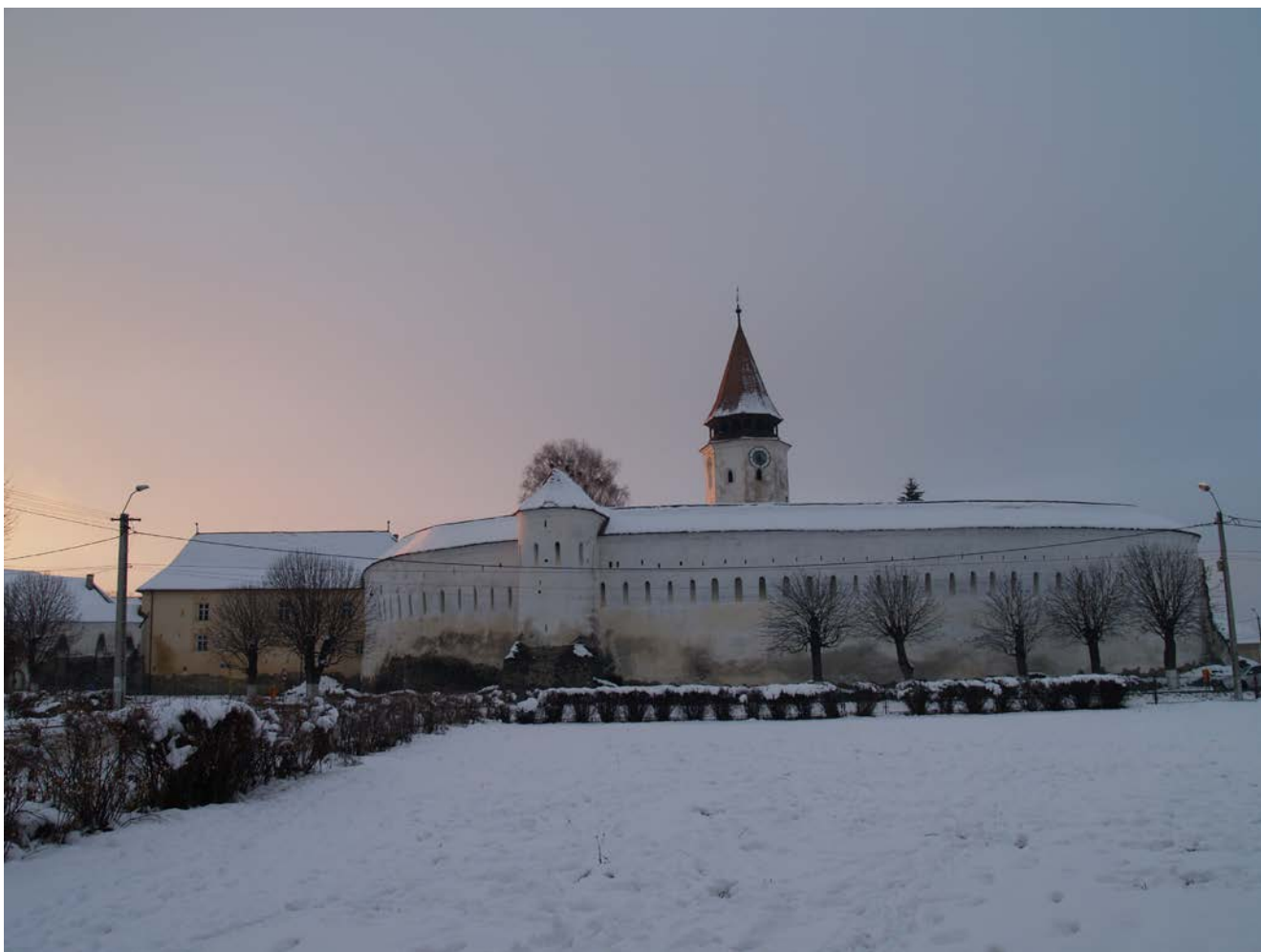
Prejmer. Perspectivă asupra bisericii fortificate dinspre sud-est

Prejmer: 1. Biserica evanghelică are infiltrații în zidul de sud al corului din cauza rezolvării precare a sistemului de scurgere a apei pluviale. Aceeași deficiență cauzează deteriorări serioase la structura