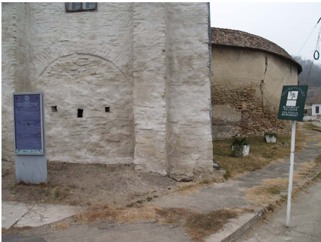
Valea Viilor. Biserica evanghelică fortificată. Panouri de semnalizare a monumentului