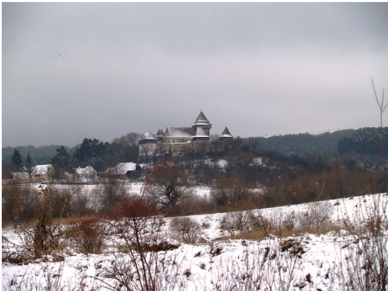
Viscri. Perspectivă asupra satului și a bisericii fortificate, dinspre nord

Valorile siturilor, ca și semnificația acestora, așa cum au fost definite la momentul înscrierii și extensiei sale au rămas neschimbate.