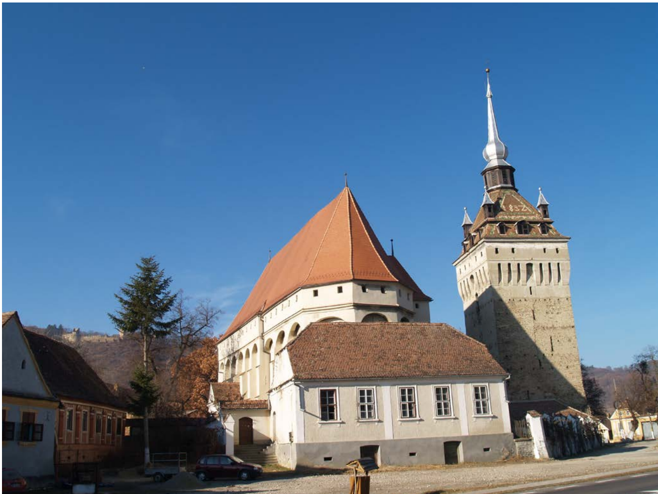
Saschiz. Biserica fortificată, restaurată 2000- 2011 și turnul clopotniță, inclus în Planul Național de Restaurare

În cadrul Programului desfășurat de Ministerul Dezvoltării Regionale și Turismului (MDRT), în baza HG nr. 738 din 9 iulie 2008 privind stabilirea măsurilor necesare în vederea finanțării, elaborării și actualizării documentațiilor de amenajare a teritoriului și urbanism pentru zonele cu monumente istorice care fac parte din Lista Patrimoniului Mondial, în anul 2011 au fost finalizate și se află în curs de avizare Planurile Urbanistice Zonale (PUZ) pentru toate localitățile cu zone înscrise în LPM UNESCO, poz. 596 bis.