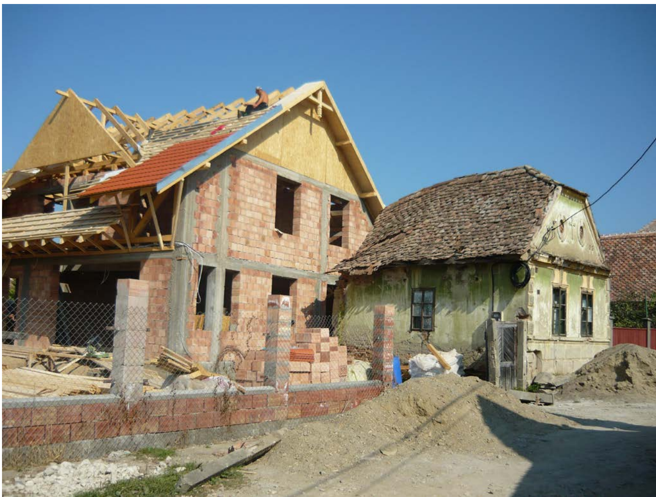
Biertan. Casa nr. 36 din cartierul românesc, demolată în decembrie 2011, fără autorizație

Biertan: 1. Cf. Raport DCPN Sibiu 2011- Planșe cu fotografii – Clădiri cu valoare arhitecturală și ambientală , 7 clădiri necesită intervenții de urgență. 2. Zugrăveli în culori sintetice stridente: str. Avram Iancu nr. 15, nr. 34; str. Nicoale Bălcescu nr. 58; str. Avram Iancu nr. 15, nr. 34, nr. 43; str. Horea nr. 9, nr. 22, nr. 36; str. Tudor Vladimirescu, nr. 2. 3. Biserica evanghelică fortificată: stare proastă a portalurilor de sud și de vest – pierderi masive de material litic. Bolta sacristiei este în stare critică, umiditate în exces în zidul incintei a 2-a. Fisuri inactive la absidă (martori fixați în 5.06.1999). Umiditatea crescută cauzată de un dren efectuat defectuos în 2010 a produs tasarea și fisurarea terenului la est de cor, și împingeri în zidul de incintă. Ventilarea interioarelor turnurilor Muzeul și Turnul catolicilor a fost rezolvată prin instalarea unor grilaje în loc de uși. 4. La casa de pe str. Avram Iancu nr. 3, frontonul cu inscripție "1786" are fixat un cadru metalic pentru cabluri de curent electric. 5. Casa de pe str. Crișan nr. 36, ce definea caracterul centrului cartierului românesc, alături de școală și casa nr. 35, a fost demolată în noiembrie 2011, fără autorizație.