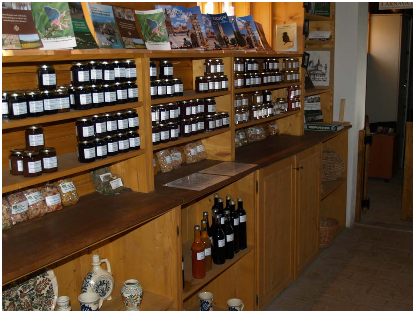
Saschiz. Noul Centru de Informare Turistică comercializează și produse tradiționale locale

Saschiz: Fundația ADEPT a inițiat recuperarea tradiției producerii casnice de dulcețuri, gemuri și siropuri de fructe, zacuscă și miere (27 sortimente). În 2010 s-a deschis fabrica de gemuri și siropuri (Transylvania Food Company). „Dulceața de Rubarbă” este marcă înregistrată.