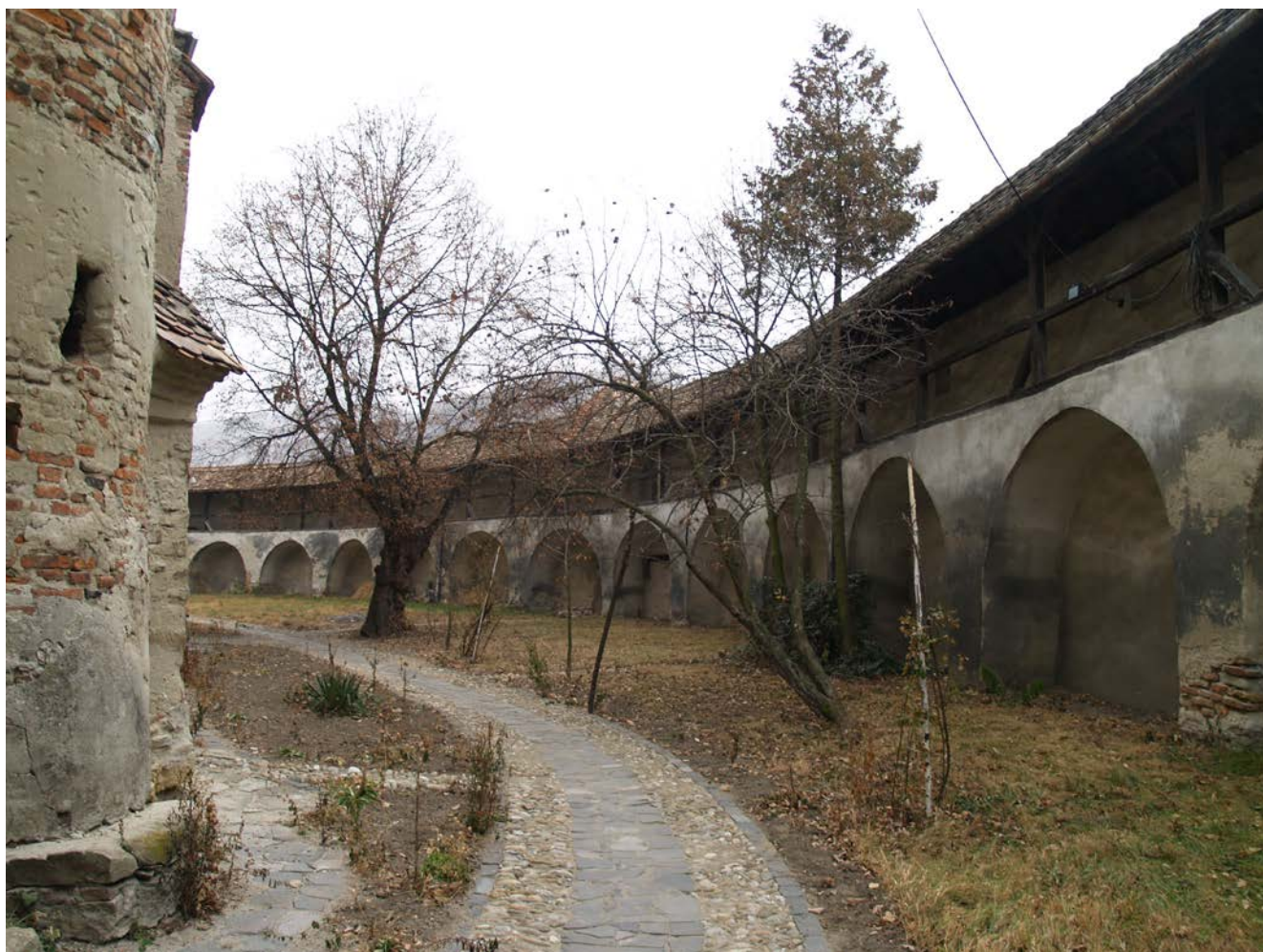
Valea Viilor. Biserica fortificată, zidul de incintă cu drum de strajă și sistemul de drenaj refăcut în 2011

Valea Viilor: PUZ – Zona Protejată și Zona de Protecție aferentă, Faza III. Contract nr. 319/2007, Proiect nr. 4823, dec.2008, SC „Proiect Alba” S.A. Se propune extinderea zonei de protecție a sitului.