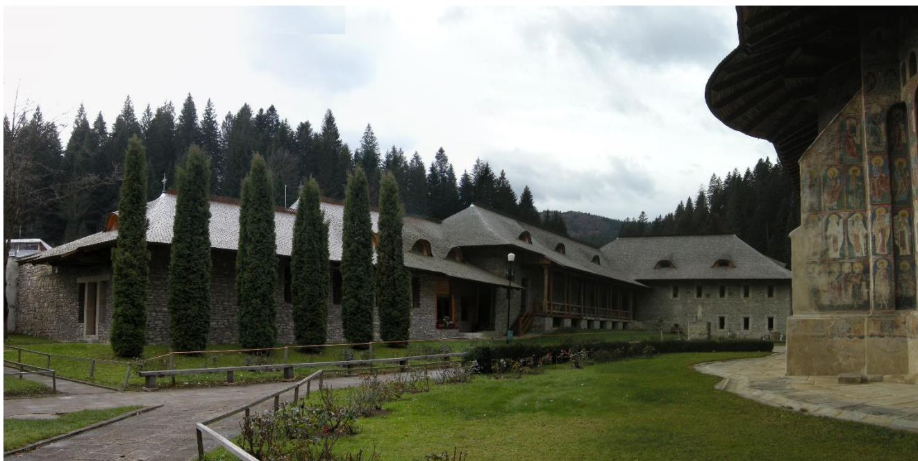
Clădirile nou ridicate în incinta istorică a Mănăstirii Voroneț