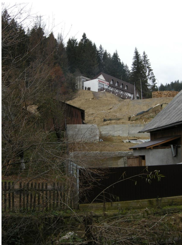
Imagini ale alunecării de teren, cu zidurile de sprijin prăbușite sau fracturate