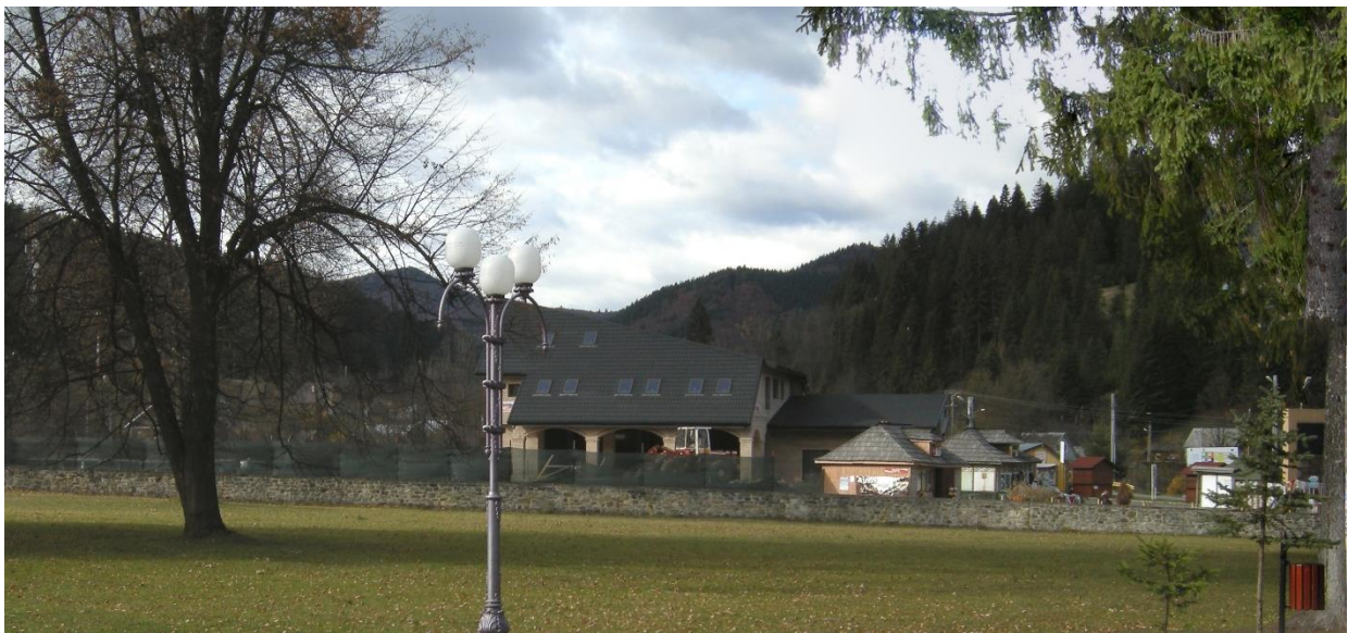
Zona parcării văzută dinspre accesul în incinta fortificată a mănăstirii, în prezent