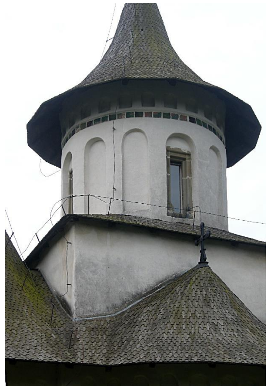
Degradări ale acoperișului din șită al Bisericii „Înălțarea Sfintei Cruci” din Pătrăuți