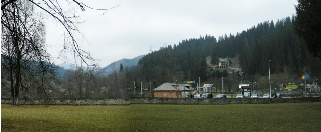
Zona parcării văzută dinspre accesul în incinta fortificată a mănăstirii, înainte de construire